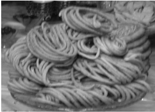
<사진 III-4> sangza