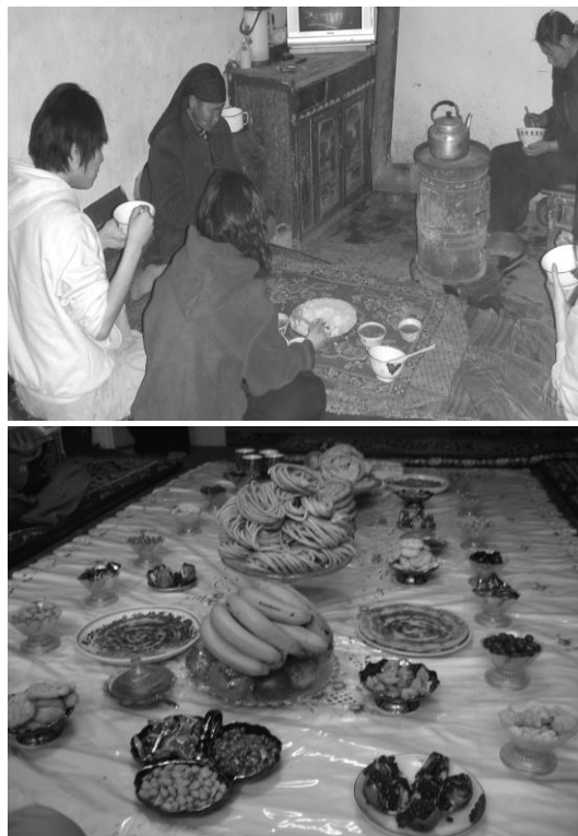
<사진 III-9> 식생활

키르키즈족은 어린 아이들을 그들의 진정한 재산이라고 여기며, 물질적으로 아무리 부유해도 자녀가 없으면 가난하다고 여긴다. 또한 무슬림은 술을 마시지 못하도록 금지되어 있지만, 키르키즈족 사이에서 알코올 중독은 일반적인 것이다. 키르키즈족은 이슬람의 영향으로 돼지고기, 말고기, 개고기 등을 먹지 않으며 동물의 피로 만든 음식을 먹지 않는다. 또한 그들은 말을 타고 주택가를 지날 때에는 빠른 속도를 내서는 안 된다. 말을 빠른 속도로 몰고 지나가는 것은 불길한 소식을 전한다고 여기기 때문이다. 식사 시에는 손을 씻고 손등의 물은 그대로 털어내서는 안 되며 반드시 수건으로 닦아야 한다. 타인의 집에 초대 받은 손님일 경우엔 반드시 음식을 남겨야 하며, 손으로 음식을 만지거나 소리 내어 음식의 냄새를 맡는 행동과 다른 이의 그릇이나 수저를 움직이는 행동을 해서는 안 된다. 그리고 좌식문화라서 밥상 위에 차리기도 하지만 대부분은 구별된 식탁보와 같은 것을 놓고, 그것 위에다가 음식을 놓고, 먹는데 밥상이나 식탁보에는 식사와 관련된 물건을 제외하고, 다른 물건은 올려두는 것은 실례가 된다. 식탁보는 밝은 것은 또한 무례가 된다.