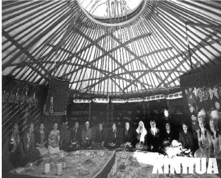
<사진 III-6> 짚방

두 단층 의 형태를 이루고 있다. 집 안에는 손님을 접대하는 방과 가족이 자는 방, 2개로 나누어 져 있다. 가족이 자는 가운데에 난로가 놓여 있으며 방안에서 식사, 요리를 한다.