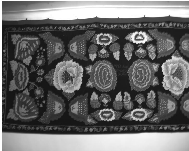
<사진III-1> 키르키즈족 양탄자

키르키즈족의 특산물로는 말 우유, 건포도, 무화과, 빠다무(견과류의 일종) 등이 있다. 이외 자급자족이 불가능한 것들은 외부에서 구입하는데, 축산물을 제외한 대부분의 농산물, 생활 필수품 등은 차를 타고 도시로 나가서 사온다. 향은 소도시에서 소도시에서는 대도시에서 대도시에서는 다른 대도시나 외국에서 물자를 공급한다.