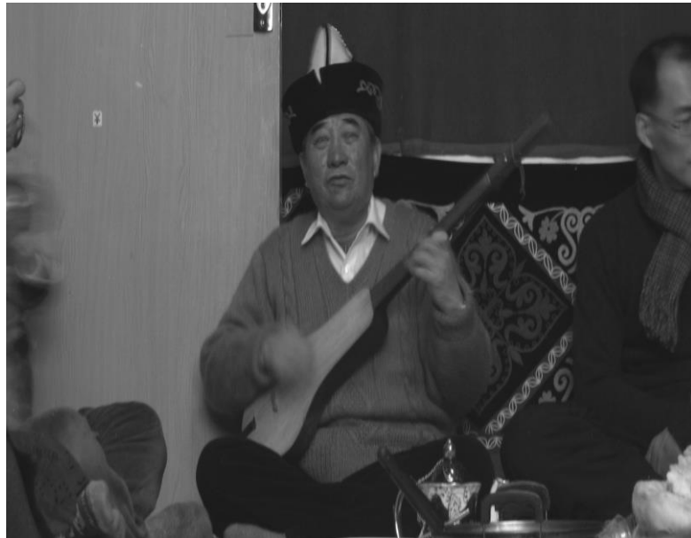
<사진 III-7> 코모즈 악사

키즈 민족의 음악은 그들의 전통생활을 반영하고 있고, 자연 속의 숲, 대지, 초원, 목장을 배경으로 한 영웅들의 전설과 이야기를 나타낸다. 키르키즈족이 외래 침략자들에 대하여 용감한 분투와 투쟁을 벌인 업적을 그들의 노래 속에서 찾을 수 있다. 위에서 언급한 마나쓰에 대한 노래도 있으며, 노래를 부르며 춤을 추기도 한다. 그리고 주로 사용하는 전통악기로는 코모즈라는 현악기가 있는데 3개의 줄로 만들어져 있고, 크기는 50cm정도로 기타보다 많이 작으며, 소리는 높고 경쾌한 소리를 낸다. 41