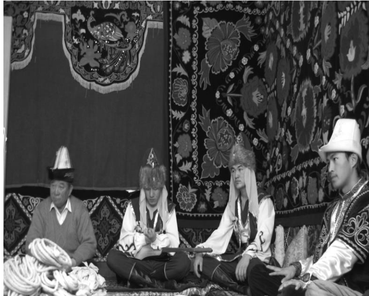
<사진 III-8> 전통의상

도시의 경우, 신랑측에서 집을 마련해주고, 결혼에 필요한 비용을 마련한다. 신부측에서는 집에 들어갈 가구를 준비하고, 손수 만든 벽걸이(위에서 언급한 카페트와 비슷한 벽을 덮는 자수품)를 신랑측에 선물한다.