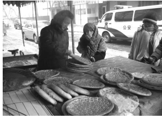
<사진 III-5> 난

이 외에도 손님을 접대할 때는 다양한 음식을 먹는데, 예를 들면 Sangza 29 , 난 30 , 키르키즈 전통 과자, 석류 그리고 기타 과일과 간식들이다.