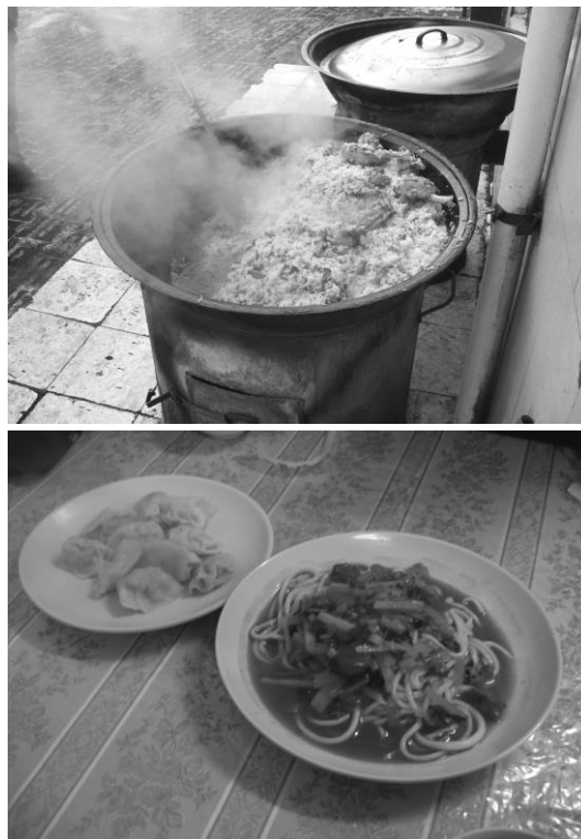
<사진 III-2> 짜판

키르키즈족의 음식은 반유목생활과 긴밀한 연관이 있다. 일반 가정에서 먹는 주 음식은 양고기를 넣어서 요리한 밥과 면류가 있으며 부식으로 난과 과일을 먹는다. 양고기를 넣어서 요리한 밥은 짜판 27 이라 하며 면은 반미엔 28 이라고 한다.