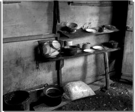
대나무로 지어진 몽족의 전통가옥(좌)과 주방(우)의 모습