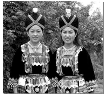
몽족의 전통의상을 입은 여인들

몽족의 전통의복은 그들의 숨씨와 예술성을 반영한다. 천제적으로 빨간색의 자수를 놓아 검은색의 남성 면상의 여성용 앞치마를 장식한다. 전통의 복 중 일부분인 소품은 의상가방, 허리띠 및 스커트로 구성되어있다.