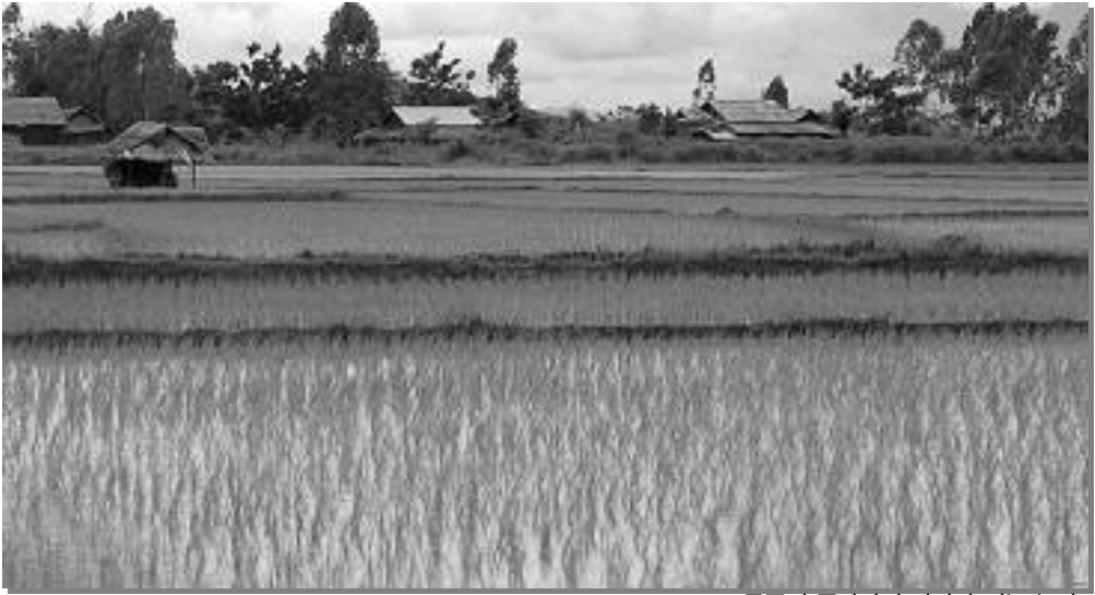
몽족의 주산업의 터전이 되는 논밭