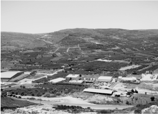
〈그림 III-6〉 골란의 드루즈 과수원지 전경

마을 거주지 쪽에는 음식점, 옷 가게, 슈퍼마켓 등의 일반 상점들과 집을 짓거나 내부 인테리어 등 건설업에 관련된 쪽에 종사하는 사람들을 볼 수 있다. 또한 시리아로 유학가는 학생 36 이나 해외여행자를 대상으로 보험회사와 환전소가 많이 있다.