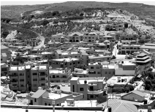
〈그림 III-4〉 마즈달 샴마을의 전경

마즈달 샴스가 위치한 골란고원은 평균 해발고도 1,000m의 고원지대로 이스라엘 동북부의 시리아 접경지, 다마스쿠스 남단에 있다. 서쪽으로 요르단강 계곡, 남쪽으로 야르무크 강 계곡을 끼고 있다. 골란고원은 ‘이스라엘의 눈(Eyes of Israel)’이라고 불린다. 이는 시리아와의 국경을 접하고 있는 고원으로서 적군의 움직임을 쉽게 포착할 수 있다는 이유에서다. 고원 내 헤르몬 산은 만년설과 호수들로 풍부한 수자원을 공급하고 있다. 또한