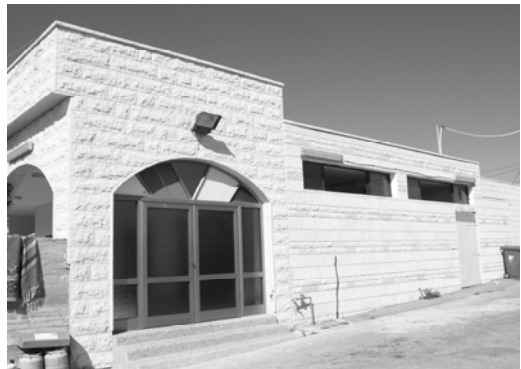
〈그림 III-15〉 칼루하

골란 마을은 네 개의 마을들 중 한 명의 종교지도자가 있다. 그는 마을 사람들의 존경을 받으며 네 마을의 종교에 관련하여 영향력을 행사하고 있다. 하지만 그 외의 정치, 행정적 영역 등에 관해서는 권한이 없다. 이십 여 년쯤 전에는 마즈달 샴스의 우칼의 비율은 마을 인구의 약 절반 이었는데 현재는 고령의 우칼들만이 마을 인구의 약 5%를 차지하고 있으며, 현재도 감소하고 있는 추세이다. 그 이유는 마을이 시대의 흐름을 따라 점점 개방화 되며, 외국으로 유학 다녀온 드루즈 젊은이들의 의식이 바뀌어 가고 있기 때문으로 추정된다. 마즈달 샴스마을 내에 드루즈의 기도장소인 칼루하가 마을 꼭대기 쪽에 한 개 위치하고 있다. 드루즈 기도의 장소로만 알려져 온 칼루하는, 이 경우 자체 리더십 선출과 같은 마을의 중요한 일을 결정하는 일에, 또는 우칼 아이들의 종교를 가르치는 곳으로 쓰인다. 드루즈가 아닌 외부인의 출입은 금지된다.