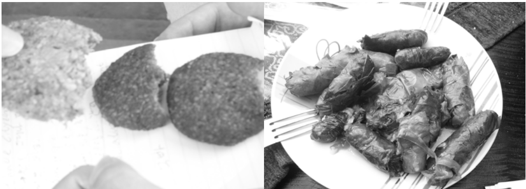
〈그림 III-8〉 쿠키(왼쪽)와 와락 까라넵(오른쪽)

드루즈는 가족이나 친구와 교제하거나 손님이 왔을 때 집에서 직접 만든 쿠키와 차를 대접한다. 쿠키는 가정마다 맛과 모양에 차이가 있으나 보통 상아색에 단 맛이 난다. 차는 보통 매우 진하고 쓴 맛을 내는 아랍식 커피나 홍차의 씹쓸한 맛이 나는 ‘사이’라 불리는 차를 마시는데, 기호에 맞게 설탕을 넣어 마신다.