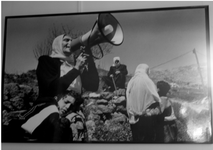
〈그림 III-11〉 샤우팅(shouting)하는 장면

골란 마을들에는 6일 전쟁으로 이스라엘과 시리아와의 국경을 사이에 두고 이산가족이 된 드루즈 가족이 많다. 이스라엘 지역의 드루즈인이 시리아 지역에 거주하는 이산가족과 직접적으로 만나는 것은 이스라엘 정부에 의해 금지되어 있다. 따라서 이산가족이 된 이들은 보통 전화와 인터넷으로 연락을 주고 받거나, 요르단과 같은 가까운 제 3국에서 만남을 갖는다. 또한, 이스라엘의 골란 마을에 접해있는 시리아 국경에서 경계선 너머로 보이는 가족에게 소리침(shouting)으로써 서로의 안부를 확인하기도 한다.