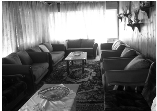
〈그림 III-10〉드루즈인의 집 내부 응접실

양 지역의 공통점은 두 곳 모두 일반적인 드루즈와 같이 산 위에 단독 주택의 형태의 집에 가문(家門)을 중심으로 가까이 모여 산다는 점이다. 따라서 가문을 중심으로 소유하고 있는 집과 그 토지가 세습되어 오고 있다.