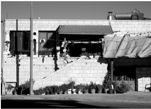
〈그림 III-12〉결혼식을 준비하는 드루즈 가정

드루즈의 결혼식 문화는 이슬람의 형태를 많이 간직하고 있는 편이다. 하지만 일부일처제는 이슬람 50 과는 분명히 구별되는 드루즈의 특징이다. 배우자 선택은 드루즈 내에서만 가능하고, 만약 드루즈가 아닌 사람과 결혼할 경우에는 드루즈 사회를 떠나야 한다.