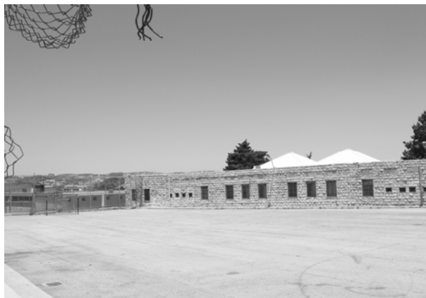
〈그림 III-15〉 이르 카멜의 학교

이르 카멜 안에는 4개의 초등학교와 1개의 중학교가 있다. 일부 학생은 더 질 좋은 교육을 위해서 하이파에 있는 학교까지 통학을 하거나 텔아비브 및 예루살렘에서 기숙사 생활을 하며 학교를 다니기도 한다. 이르 카멜시 안에 영어, 음악, 미술학원 등 과외 교육 시설이 있다.