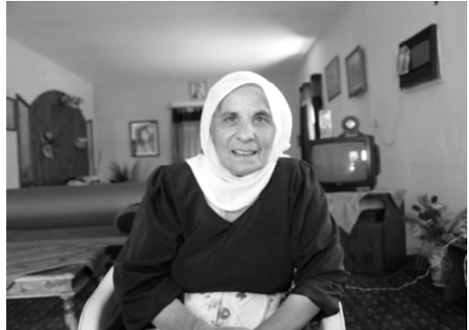
〈그림 III-9〉 우칼 여성의 복장

주할의 경우는 겉으로 잘 드러나진 않지만 지역마다 옷 입는 양식이 조금씩 다르다. 그 이유는 종교 규율이 각 지역의 종교 지도자들에 의해 정해지고, 지역 별로 개방화 된 정도에 따라서도 영향을 받기 때문이다. 상대적으로 보수적인 이르 카멜의 경우는 남성이 민소매 셔츠나 반바지 등의 짧은 옷을 입지 못하며 여성이 귀걸이, 반지를 착용하는 것도 허용되지 않지만, 골란 마을 경우에는 가능하다.