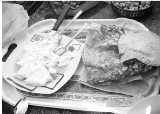
〈그림 III-7〉 레바니(왼쪽)와 호베스(오른쪽)

드루즈 사람들이 일반적으로 아침식사로 먹는 음식이다. ‘호베스(왼쪽)’라고 불리는 매우 넓고 얇은 빵(오른쪽) 38 에 올리브 기름에 담아 놓은 치즈 덩어리인 ‘레바니’ 39 를 바른다. 그리고 빵을 돌돌 말아서 토마토나 오이와 같은 야채와 함께 먹고 짠 맛의 소스에 담아 놓은 올리브 열매를 곁들여 먹기도 한다. 호베스와 레바니는 일반적으로 가정에서 직접 만들며 남은 호베스는 냉동실에, 레바니는 실온에 보관한다.