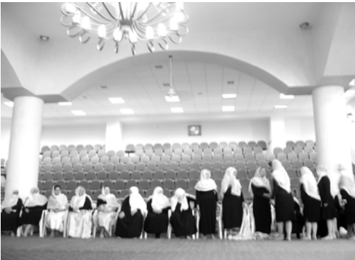
〈그림 III-13〉 다마스쿠스센터에서의 추모식

드루즈인이 죽으면 그날 곧바로 장례행사를 치르는 것이 원칙이며 늦어도 다음날로 미루지 않는다 52 . 시체는 깨끗이 씻어 정결한 옷으로 갈아 입히고, 죽은 사람과 관련된 모든 사람들이 모인 가운데 장례식을 치른다. 이르 카멜에는 시내에 공동묘지(Cemetery)가 한 곳 있는데, 공동묘지 정 중앙에 직육면체의 단이 위치한 장례식장이 있어서, 많은 사람이 모여