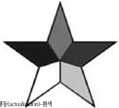
〈그림 III-16〉 드루즈별

책은 오랜 시간 깊은 묵상을 통해서만 이해할 수 있다고 한다. 하지만 책의 모든 내용을 마음의 묵상을 통해 모두 이해한 사람의 거의 없다고 한다. 높은