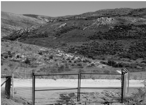
〈그림 III-2〉 이스라엘과 시리아의 국경

현재 골란고원에는 전쟁을 겪은 드루즈인과 소수의 무슬림이 있으며, 이스라엘의 골란고원 점령 이후 들어온 유대인들이 있다. 최근 유대인 정착촌이 확장되면서 드루즈의 입지