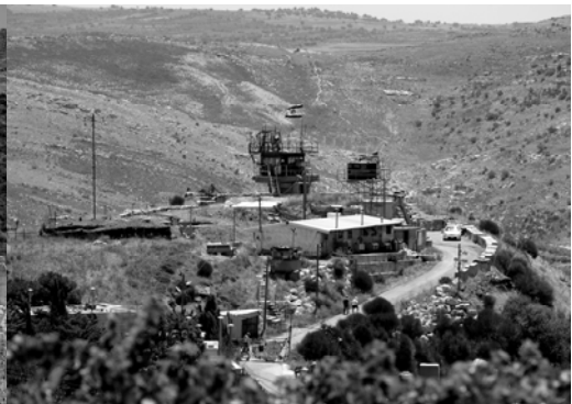
〈그림 III-3〉 골란 고원의 이스라엘 초소