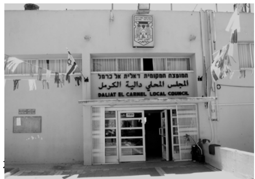
〈그림 III-5〉 이르 카멜시의 지역 의회