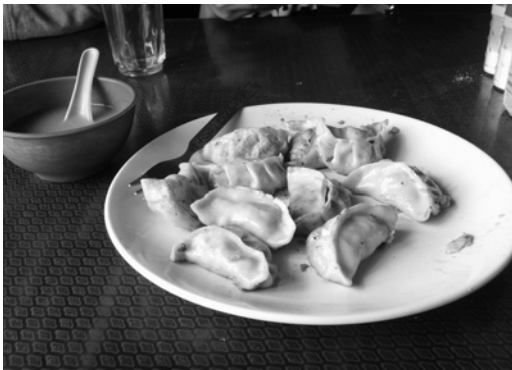
〈그림 IV-1 모모〉

몬 종족은 라다크 지역 음식인 모모(Momo), 뚝빠(Thuckba), 스큐(Shkyu)등을 주로 먹는다. 모모는 한국의 만두와 비슷하고, 뚝빠는 밀가루 반죽과 야채를 푹 끓인 수제비 같은 음식이다. 몬 종족은 이 음식들 외에도 라다크에서 쉽게 접할 수 있는 다른 인도 음식들도 먹는다. 계절별, 행사별, 절기별로 특별히 먹는 음식이 정해져 있지는 않다. 또한 손님을 접대할 때 내놓는 음식은 다른 인도 지역과 마찬가지로 짜이 35 와 과자가 있었다.