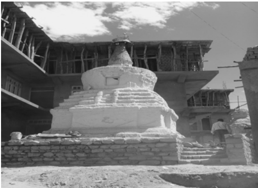
〈그림 VIII-1〉 초르텐

이와 같은 정경은 레 디스트릭트의 외각지역에 위치한 쉐 마을이나 초글람사 마을과 같은 곳에서도 볼수있다. 몬 종족이 모여사는 초글람사 마을에도 곳곳에 초르텐들이 있다. 몬 종족을 설명하는데 있어서 티벳불교는 빼놓을 수 없는 요소이다. 본 리서치팀이 만난 몬 종족의 대부분이 충분한 교육을 받지 못한 사람들이어서 종교적 지식이 깊지는 않았지만 그럼에도 불구하고 그들의 삶 가운데 티벳불교가 깊게 영향을 미치고 있다. 그런 이유로 이 글에서는 범위를 넓혀 레 디스트릭트의 종교상황을 다루되 필요할때마다 몬 종족에 대한 설명을 덧붙이도록 하겠다.