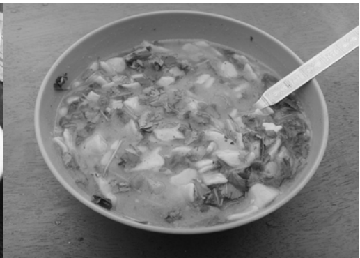
〈그림 IV-2 뚝빠〉