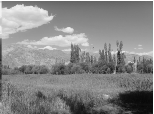
〈그림 III-2 쉘 마을 전경〉