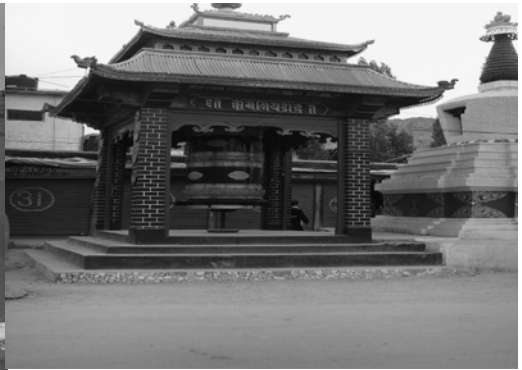
〈그림 VIII-2〉 마니통