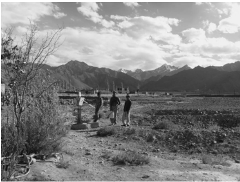
〈그림 III-1 초글람사 마을 전경〉

몬 종족을 만나기 위해 본 조사팀이 방문한 곳은 레 도시에서 가까운 쉘(Shey), 초글람사(Choglamsar) 이 두 마을이다. 레 도시에서 약 20km떨어진 곳에는 초글람사 마을이 있으며 20km정도 더 가면 쉘 마을에 도착할 수 있다. 쉘 마을은 하천이 흐르고 초원과 나무들이 우거진 곳이 많았고 그 주위에 집들이 위치해 있었는데 몬 종족은 이 마을에 많이 거주하지 않았다. 반대로 초글람사 마을은 하천으로부터도 500m이상 떨어져 있었고 농사를 지을 수 없는 척박한 땅에 집들이 위치해 있었다. 초글람사 마을에는 몬 종족이 10가구 이상 거주한다. 쉘과 초글람사와 같은 마을들은 레 도시와 달리 하천 오염도 심하지 않고, 주민들도 라다크 인이 대부분이었다.