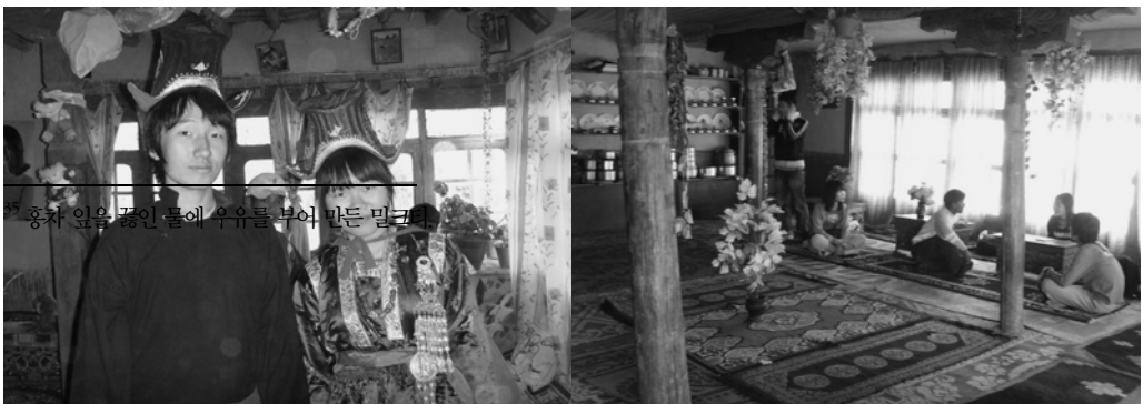
홍차 잎을 끓인 물에 우유를 부어 만든 밀크

몬 종족의 전통의상은 곤차라고 하는 라다크 전통의상으로 곤차는 주로 특별한 날이나 형식을 갖추는 날에 입는다고 한다. 곤차는 두껍기 때문에 여름에는 남성은 얇은 일반 셔츠와 바지를 입고, 여성은 인도전통 의상인 편자비를 주로 입는다. 겨울에 남성은 두꺼운 셔츠와 바지, 여성은 두꺼운 편자비를 입고 그 위에 자켓을 걸쳐 입는다. 몬 종족의 젊은이들은 청바지나 티셔츠 같은 옷을 즐겨 입기도 한다. 결혼식 날에 남성과 여성은 샤디(Shadi) 라고 하는 화려한 결혼식 의상을 입고 모자 등과 같은 그에 맞는 장신구와 액세서리들을 착용한다.