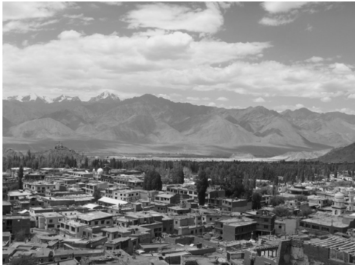
〈그림 II-1 레 도시 전경〉

레는 겨울철이 되면 섭씨 영하 40도까지도 내려가서 실외에서의 활동하기에 적합하지 않아 레 주민들은 겨울철에는 바깥 출입을 거의 하지 않는다. 대신 여름철에 집중해서 생업에 종사하며, 라다크 주민이 아닌 외부인(관광객, 관광업을 목적으로 온 이주민)들은 겨울엔 다른 온화한 기후의 지역으로 옮겨 가 생활한다.